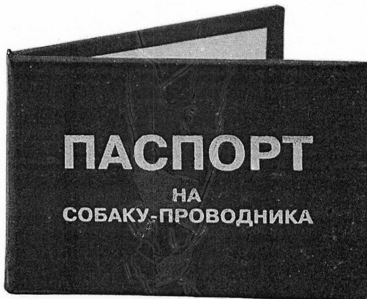
Рис. 1. Лицевая сторона паспорта на собаку-проводника

Документом, удостоверяющим специальную подготовку собаки-проводника, является паспорт на собаку-проводника (рис. 1, 2), форма и порядок выдачи которого определены приказом Министерства труда и социальной защиты Российской Федерации от 22.06.2015 № 386н.