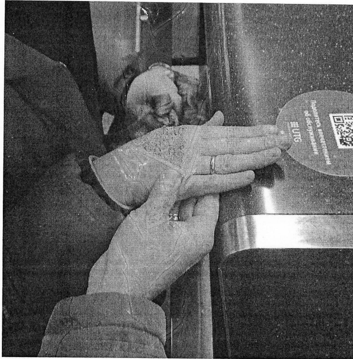
Рис. 4. Помощь пассажиру с инвалидностью по зрению при ознакомлении с каким-либо предметом

При оказании помощи необходимо помнить, что незрячий человек в состоянии самостоятельно совершать различные действия, например: пользоваться умывальником, уборной, осуществлять посадку на пассажирское кресло или автомобиль и др. Задача сотрудника, обеспечивающего ситуационную помощь пассажиру с инвалидностью, сориентировать незрячего в ситуации, описывая расположение предметов и объектов, например: «Ваша сумка находится на сидении справа от Вас», «В туалетной кабинке унитаз находится по движению прямо, кнопка слива над унитазом, на уровне пояса. Держатель туалетной бумаги закреплен на стене слева, крючок для вещей у входа на стене справа на уровне плеча. Я буду ждать Вас за дверью кабинки».